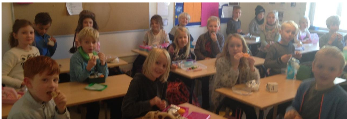
Frokosttid i 1.B

Når vi skriver en masse om nissevenner i et nyhedsbrev, er det for at dele en opmærksomhed med jer. Vi ved, at nissevenskaberne fylder meget hos børnene, og at det betyder rigtig meget for klasserne. Vi bruger det selv som en god anledning til at tale med børnene om alle mulige ting og tanker, som opstår. Vi håber, at I kan bruge det på samme måde. Vær også gerne opmærksomme på, at jeres børn måske har brug for noget hjælp til at huske det med nissevennerne, få gode ideer til at undgå at afsløre sig selv, eller snakke om det, der foregår i klassen.